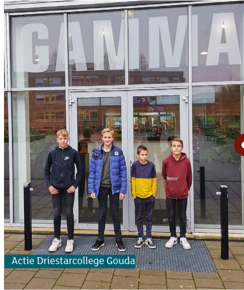
Actie Driestarcollege Gouda