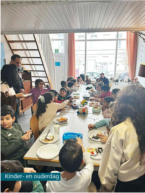
Kinder- en ouderdag