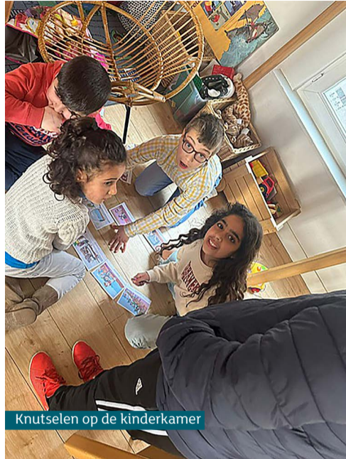
Knutselen op de kinderkamer